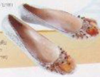
รองเท้าหนังสีเงินประดับ โลหะ Living Dolls (2,690 บาท)