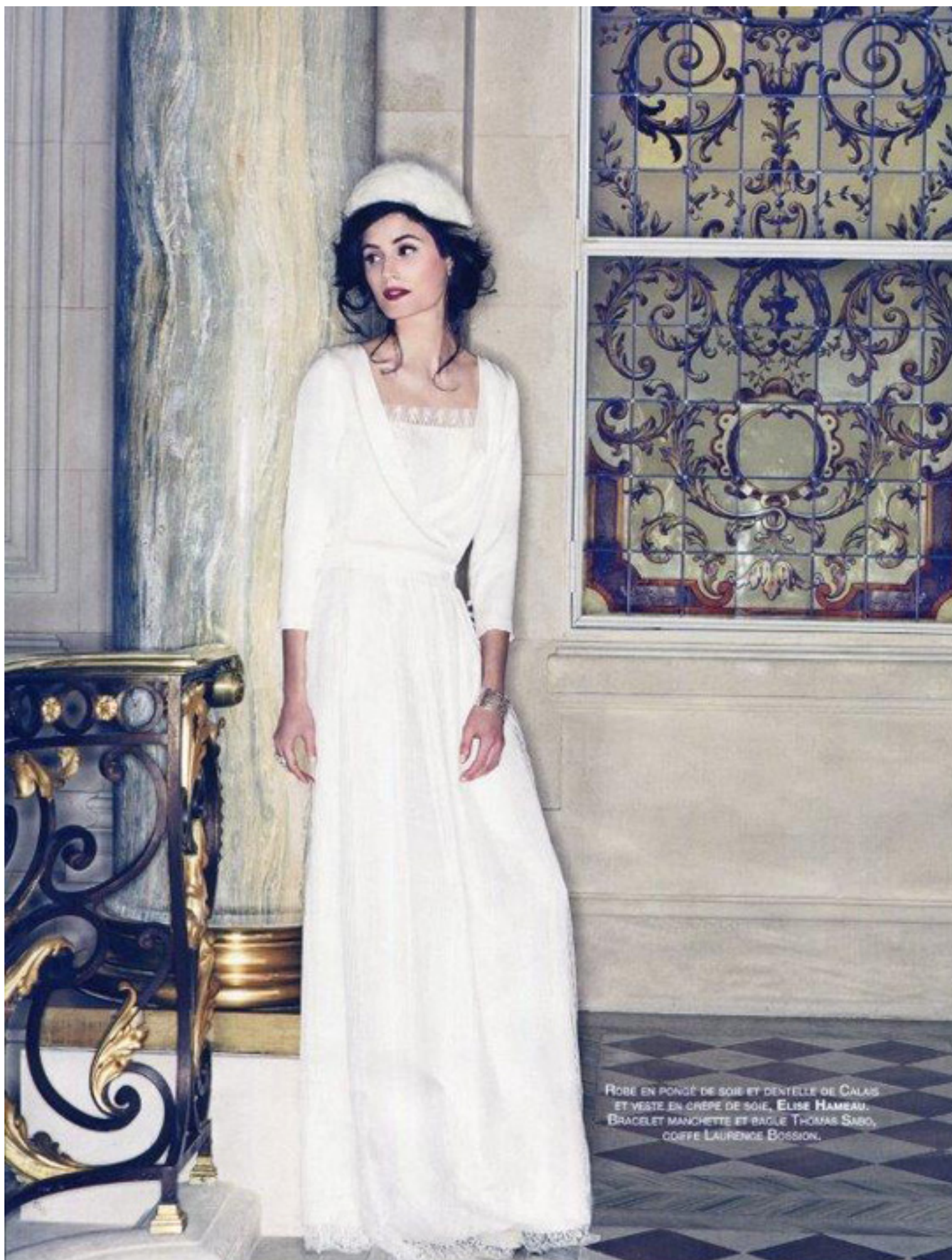
ROBE EN PONGÉ DE SOIE ET DENTELLE DE CALAIS ET VESTE EN CRÊPE DE SOIE, ELISE HAMEAU. BRACELET MANCHETTE ET BAGUE THOMAS SABO, COIFFE LAURENCE BOSSON.