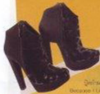
รองเท้าหนังสีเงิน Because I Love Shoes (3,990 บาท)