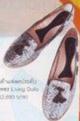
รองเท้าหนังสีเงิน ประดับโลหะ Living Dolls (2,690 บาท)