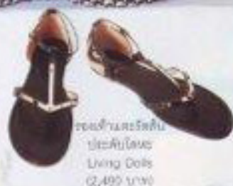
รองเท้าหนังสีเงิน ประดับโลหะ Living Dolls (2,490 บาท)