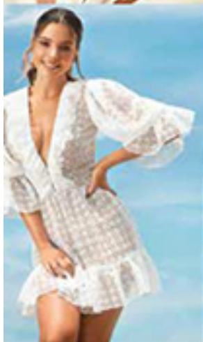
GIOAVANNA LANCELOTTI USA VESTIDO FABULOUS AGILITÀ FOTOS VINICIUS MOCHIZUKI ASSISTENTE RODRIGO RODRIGUES EDIÇÃO DE MODA CRISTIAN HEVERSON BELEZA WALTER LOBATO