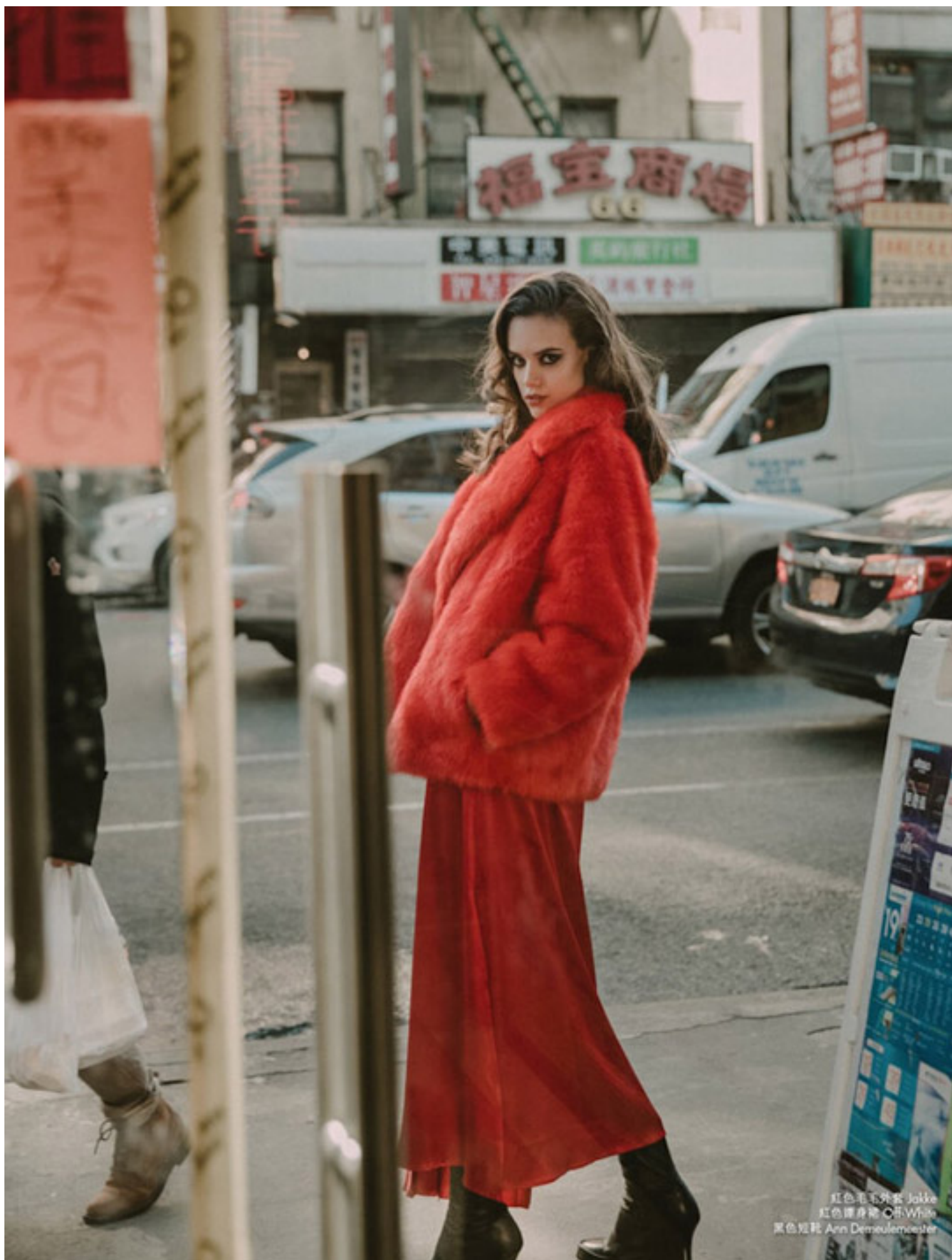
紅色毛呢外套 Jakke 紅色連身裙 C&W 黑色短靴 Ann Demeulemeester