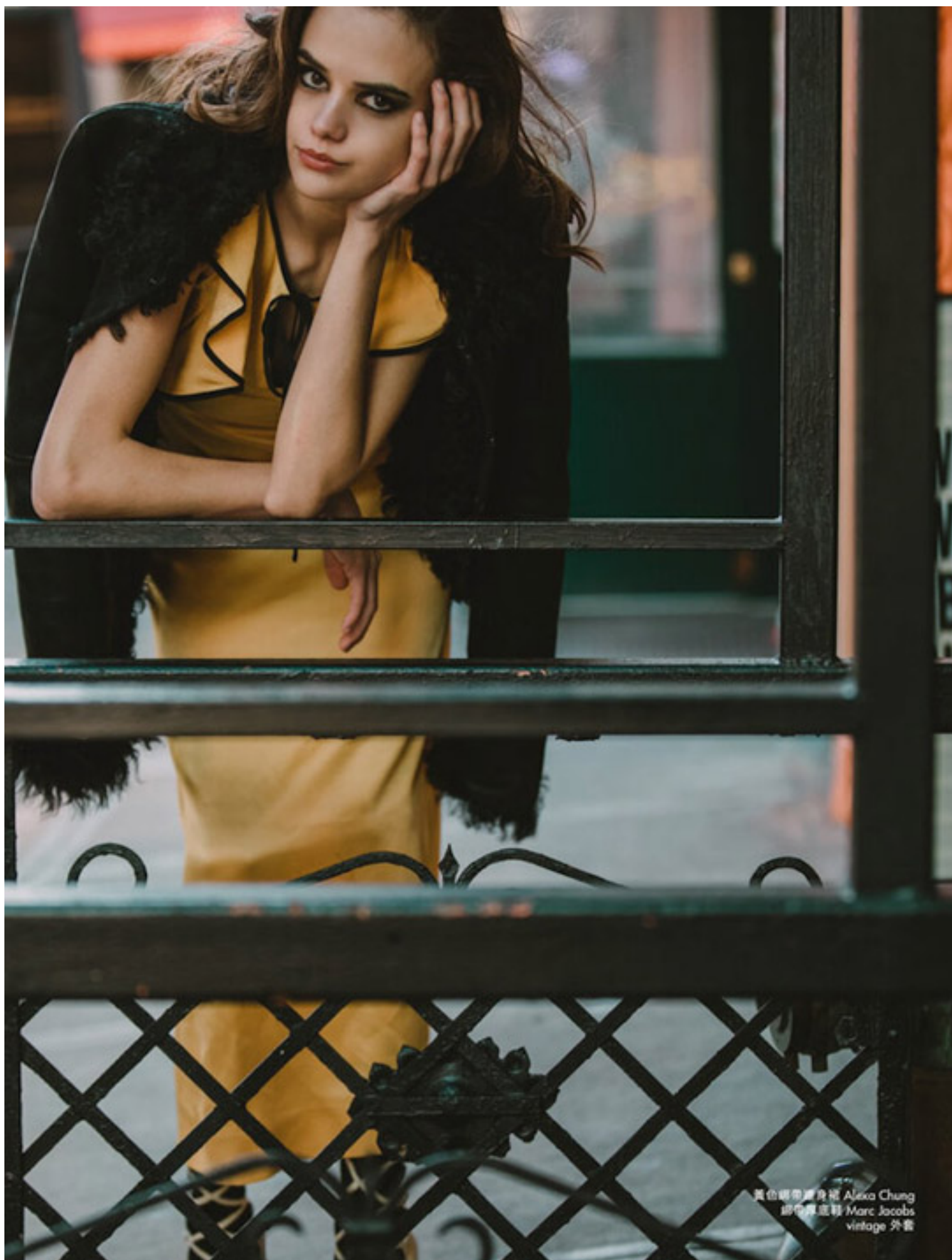
黃色綢帶連身裙 Alexa Chung 綁帶厚底鞋 Marc Jacobs vintage 外套