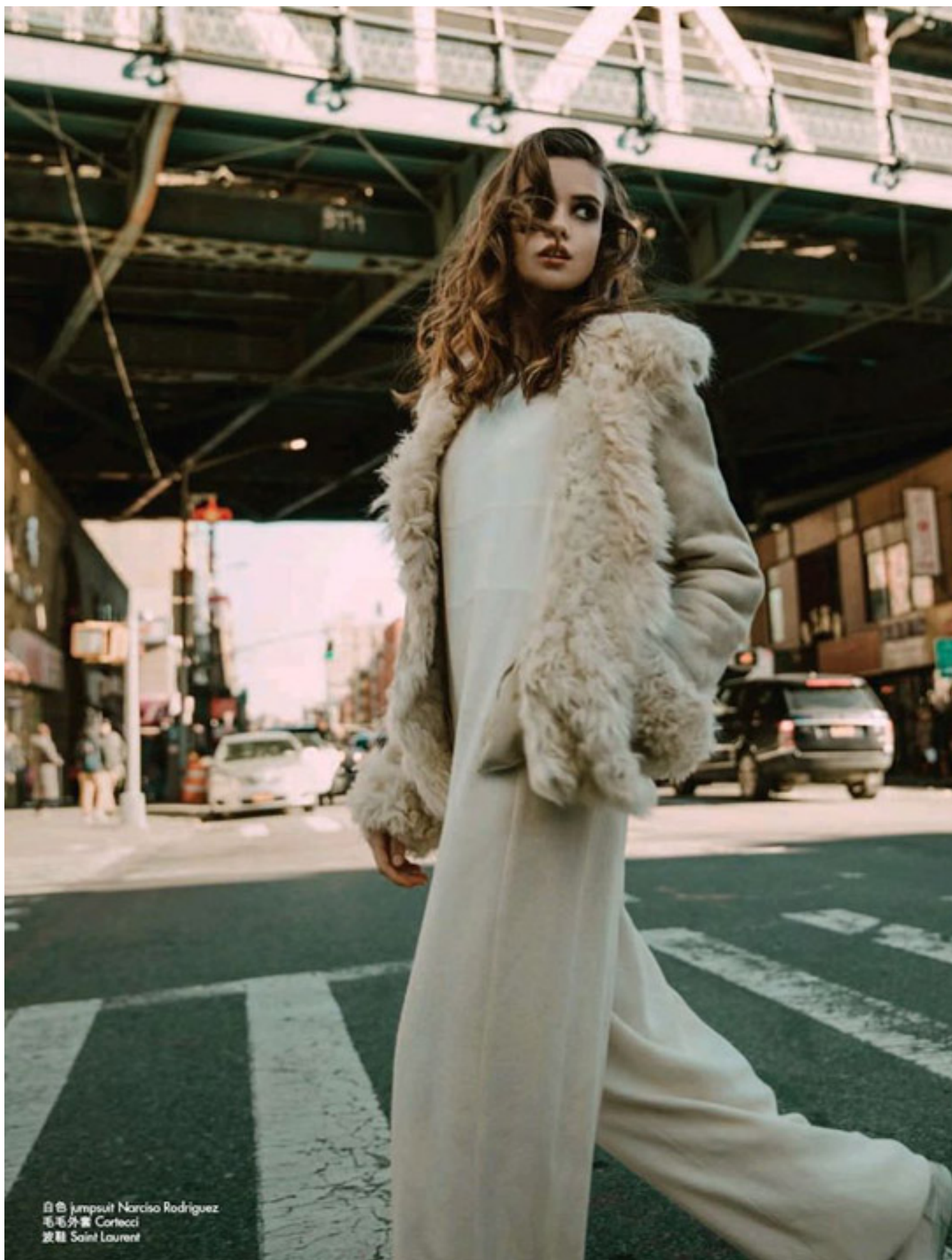
白色 jumpsuit Narciso Rodriguez 毛毛外套 Cortecci 波鞋 Saint Laurent