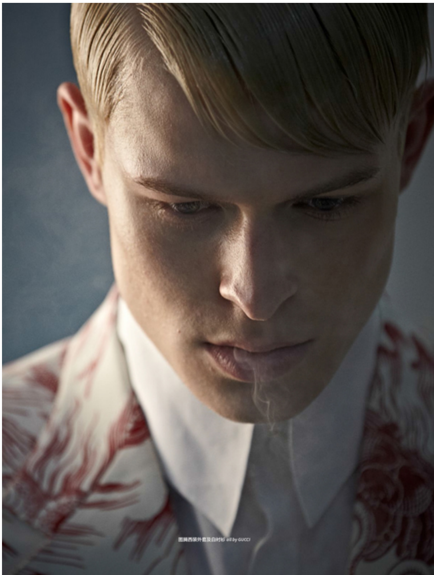
圖輯西裝外套及白村衫 all by GUCCI