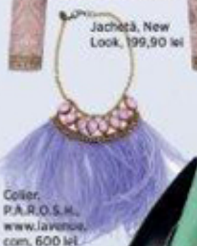
Colier, P.A.R.O.S.H., www.lavence.com, 600 lei