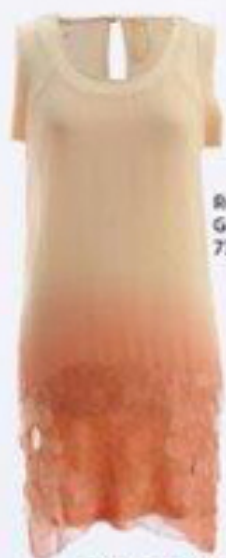
Rochie, Guess, 739,99 lei

Jeansi skinny, Motiv, 179,90 lei; flori din material textil, 43,50 lei fiecare, toate Accessorize; tricou imprimat, 49,90 lei; set brățări, 39,90 lei, și mărgelile purtate precum brățări, 49,90 lei setul, toate Reserved