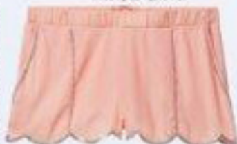
Pantaloni scurți, H&M, 134,90 lei