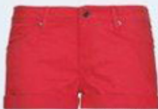
Pantaloni scurți, Mango, 129 lei