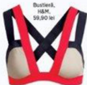
Bustieră, H&M, 59,90 lei

Bustieră, Nike, 111,99 lei; fustă elastică, BCBG Max Azria, 949 lei; maiou, 59,90 lei, și sandale din piele ecologică, 129 lei, ambele H&M; brățări din cauciuc, Accessorize, 37 lei setul; ceas, Ovette, 360 lei; sticlă pentru apă, 17,50 lei, și minge, 541 lei, ambele Adidas