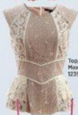
Top, BCBG Max Azria, 1239 lei