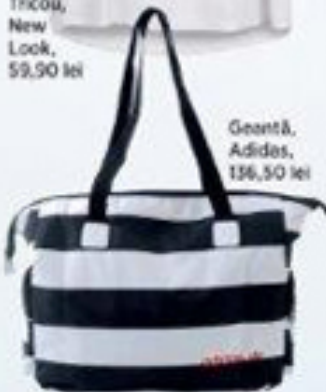
Geantă, Adidas, 136,50 lei