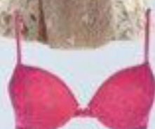
Sutien, 159 lei, și chilot, 69 lei, ambele Triumph