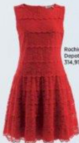
Rochie, Depot 96, 314,91 lei

Rochie din bumbac cu aplicații din dantelă, Alice McCall, www.lavenue.com , 995 lei; ham din piele, Manurî, 350 lei; colanți din dantelă, H&M, 59,90 lei; ochelari de soare, Ray-Ban, magazinul Opticris, 729 lei; flori din material textil, Bamboo, 12,99 lei fiecare