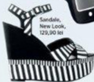
Sandale, New Look, 129,90 lei