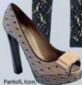
Pantofi, Icon, 499 lei