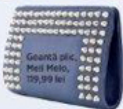
Geantă pic, Meli Melo, 129,99 lei