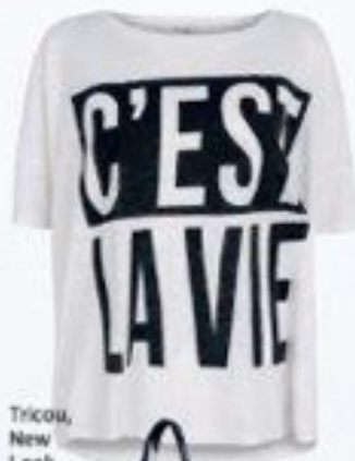
Tricou, New Look, 59,90 lei