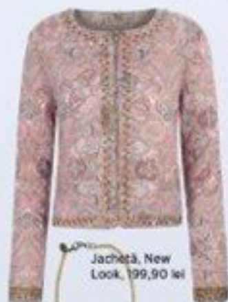
Jachetă, New Look, 199,90 lei